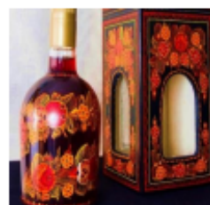
Figura 1. Combo artesanal (caja de Olinalá con licor frutal).

El artículo fue elaborado con una metodología analítica-comparativa, retomando diversos artículos que hablaban el caso del Olinalá como artesanía ancestral, se debatió la presencia de las teorías que toman mayor fuerza